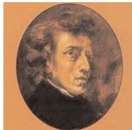
Ritratto di Fryderyk Chopin