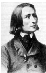
Franz Liszt, 1811-1886

nuova contro l'accademismo e contro lo spirito conservatore. Se l'opera di Schumann costituisce uno dei capitoli più interessanti, più vivi, più inconfondibili