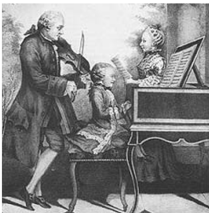
La famiglia Mozart in concerto (litografia)

Composto nel giugno 1776 a Salisburgo (dove Mozart risiede dal marzo 1775 al settembre 1777), il Divertimento KV 247 è dedicato, quale omaggio d'onomastico, alla contessa Atonia d'Arco Lodron, sorella dell'Arcivescovo Colloredo e appassionata musicofila. Sotto il profilo stilistico Mozart modifica in questo periodo la concezione dello stile galante spinto dalla volontà di sottrarre le sue creazioni, anche in quelle destinate all'intrattenimento mondano, agli "effetti" insistiti e ai virtuosismi eccessivi. La pagina per la Lodron (simile ad un Notturmo di Haydn del 1772) rimane pertanto il superbo simbolo di un brano nel quale la vibrante leggerezza diffusa va di pari passo con la serietà di uno "sviluppo" fitto di elaborazioni e sapientemente cesellato.