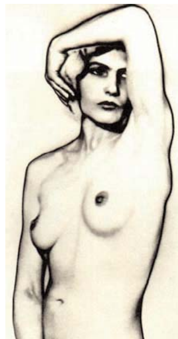
Nude (1920) di Man Ray

Dance, opening Act II, scene i. Dido, having given into love, is threatened by her alter ego, personified by the Sorceress; she imagines that the Courtiers have become Inchantresses plotting against her. She awakes, panic-stricken at the horrid music, as a puzzled Belinda emerges from the Palace. Consultation with the Courtiers leaves her no wiser, and she follows her sister in consternation. Act II, scene ii begins with the Court out hunting in the vales. Dido rushes in; intimacy has clearly taken place between her and Aeneas, and when he announces this, she realises she has lost the kingdom. Here, reality meets Dido's imagination, and the whole Court is affected by Dido's panic. She flings the crown to the ground and rushes off; but the storm that follows is a manifestation of the Sorceress, and affects only the Courtiers. A confused Aeneas picks up the crown - a symbol of his triumph - and (in Dido's imagination again) is visited by the Sorceress in the form of Mercury. The Sorceress then motivates the Courtiers first as Inchantresses, then, in Act III, as Sailors, and then as Inchantresses again. When Dido at last returns to reality, she is closely shadowed by her alter ego, for she has brought about her own downfall; as the chorus comments, 'Great minds against themselves conspire'.