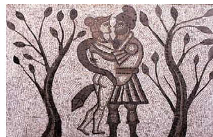
Un mosaico di epoca romana, raffigurante Enea e Didone in un tenero abbraccio.

Venerdì 29 agosto 2003, nell'ambito della sezione Lawrence del Ravello Festival, va in scena sul palco del Belvedere di Villa Rufolo (ore 22.00) l'opera di Nahum Tate, musicata da Henry Purcell, Dido and Aeneas .