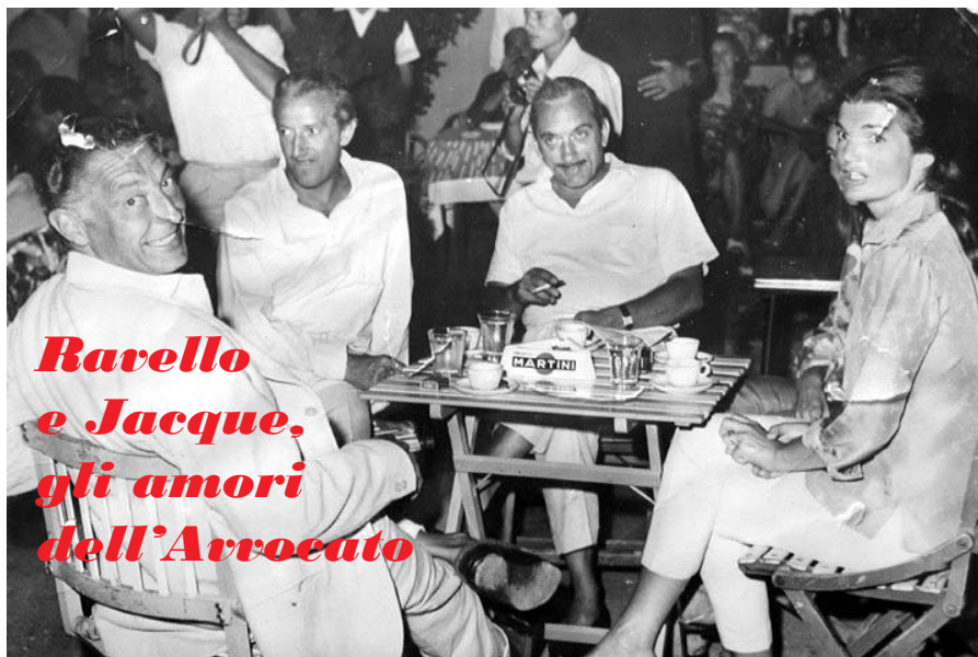
L'Avvocato Gianni Agnelli e Jacqueline Kennedy seduti con amici a un bar di Ravello

Magie... di fuochi e di luci