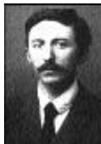
Edward Morgan Forster

around us was prosperity, beauty, and peace, and all was motionless, save the cat's-paw of wind, now travelling up the ridge on which we stood. Who moved first has never been settled. It is enough to say that in one second we were tearing away long the hillside". "As I ran", continues the narrator "the sky might have been black, and the trees, short grass, and the hillside a level rode; for I saw nothing and heard nothing, since all the channels of sense and reason were blocked.; for I had been afraid, not as a man, but as a beast".