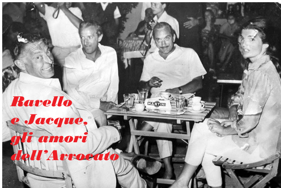
L'Avvocato Gianni Agnelli e Jacqueline Kennedy seduti con amici a un bar di Ravello

Fino a martedì 30 settembre 2003 Palazzo Sasso Salvatore De Nicola: Letture