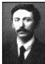
Edward Morgan Forster

around us was prosperity, beauty, and peace, and all was motionless, save the cat's-paw of wind, now travelling up the ridge on which we stood. Who moved first has never been settled. It is enough to say that in one second we were tearing away long the hillside". "As I ran", continues the narrator "the sky might have been black, and the trees, short grass, and the hillside a level rode; for I saw nothing and heard nothing, since all the channels of sense and reason were blocked.; for I had been afraid, not as a man, but as a beast".