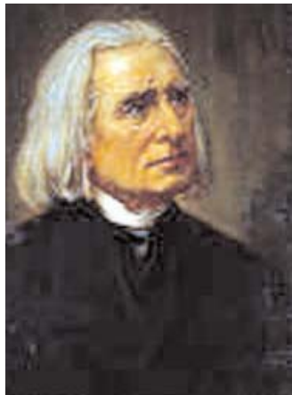
Franz Shubert, Johannes Brahms e Franz Listz