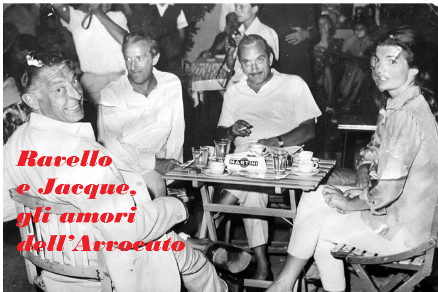
L'Avvocato Gianni Agnelli e Jacqueline Kennedy seduti con amici a un bar di Ravello

IL SANTO DEL GIORNO 14 OTTOBRE 2003 SAN CALLISTO