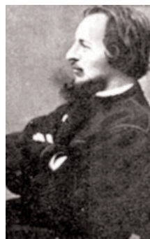
A sinistra: un'opera di Victor Hartmann (qui sopra)

In 1874 Modest Mussorgsky composed his famous Pictures at an Exhibition, based on ten drawings and watercolors produced by his recently deceased friend, the architect and artist Victor Hartmann. Most of the works that inspired the composer are lost, either yet undiscovered or, sadly, destroyed by time and neglect.