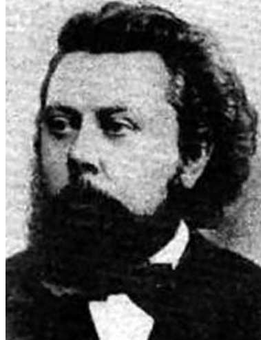
Modest Petrovic Musorgskij