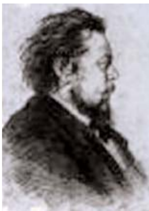
Modest Petrovic Musorgskij

della musica con un aggancio alla vita reale di immagini e colori. Tuttavia, il vero senso del lavoro non è nella pura riuscita descrittiva, ma nel rapporto stabilito fra i dieci pezzi dal titolo ispirato ai "quadri" e i cinque, denominati "passeggiata", che rappresentano l'autore e la sua riflessione soggettiva; accanto all'inventiva abbagliante dei quadri, si svolge pertanto la parallela vicenda delle variazioni sul tema della passeggiata.