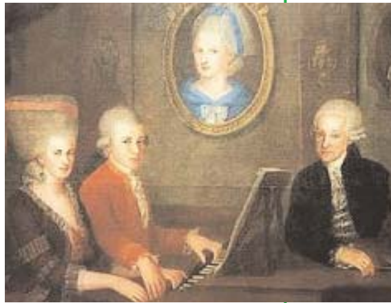
Sopra: la famiglia Mozart