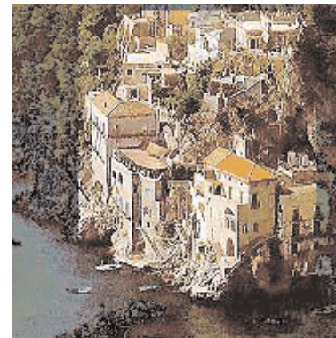
Immagini di Conca dei Marini. Sotto, la Grotta dello Smeraldo (down: the Emerald Grotto)