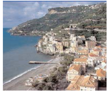
La spiaggia di Minori

Piccola perla della Costa d'Amalfi è Minori. Incastonata in una caratteristica insenatura, richiama un gran numero di turisti italiani e stranieri, affascinati dalla sua bellezza e dalla calda ospitalità dei suoi abitanti. Fra i monumenti più importanti, i resti di un'antica Villa detta Romana Marittima, risalente al I secolo d. C., ubicata alla spalle del centro cittadino ed a cui si giunge attraverso caratteristici vicoletti a volta tipici di questi luoghi. La Villa è di grande interesse per la sua struttura architettonica, nonché per la raccolta di pitture e mosaici ottimamente conservati. / Little pearl of the Amalfitan coast is Minori. Set in a characteristic inlet, it attracts a great number of both Italian and foreign tourist, fascinated by its beauty and the warm hospitality of its inhabitants. Among the most important monuments, to visit are the ruins of an ancient villa called, in fact, Villa Romana, that dates to the first century after Christ. It is located just behind the city centre and is reached by going through characteristic winding lanes, typical of these places, of great interest is its architectonic structure and its collection of paintings and mosaics in perfect condition.