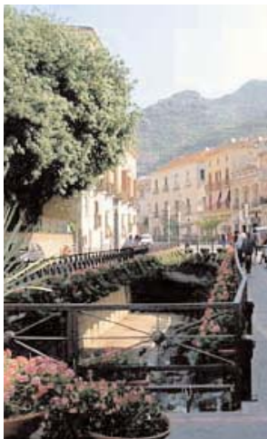
Il centro di Maiori