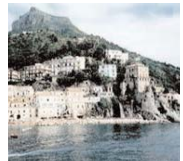
Il panorama di Cetara

Pittoresco borgo marinaro situato sulla direttrice Amalfi-Salerno ed adagiato in una dolcissima conca. Il paese vanta importanti testimonianze storico-artistiche, quali la Chiesa di San Pietro la cui costruzione risale al 1500. Gli abitanti, per lo più pescatori, sono dediti all'industria ed al commercio della pesca, disponendo di una flotta di pescherecci di alto mare, una delle più importanti del Mediterraneo. Si pratica, in special modo, la pesca del tonno. La sua graziosa spiaggia accoglie d'estate molti bagnanti che la gradiscono per la sua vita semplice e familiare. / Picturesque fishing village situated on the road between Amalfi and Salerno resting in a little valley. The town boasts of important historical and artistic ruins, among which: San Pietro's Church which was built in 1500. The inhabitants, fishermen, for the most part work in the industry and the trading of fish, having at their disposal a fleet of deep sea fishing-vessels, one of the most important in the Mediterranean. They catch tuna fish in particular. Its charming beach welcomes many bathers in the summer who enjoy it for its simple and friendly life-style.