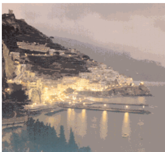
Amalfi di notte / Amalfi by night

(* via / trough Scala) (bus diretto / direct bus biglietto / ticket: 1 euro)