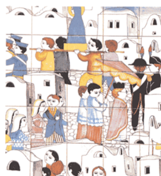
La ceramica di Vietri