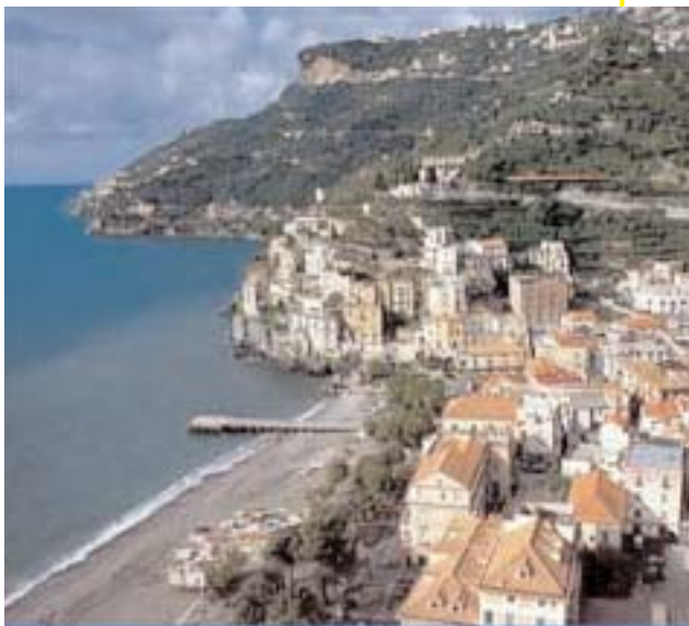
La spiaggia (the beach) di Minori

Pro Loco Piazza Cantilena ph 089/877087.