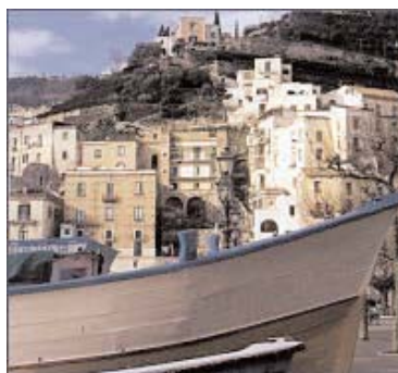
Immagini (views) di Minori oggi (today) e nell'800 (in the 18 century)