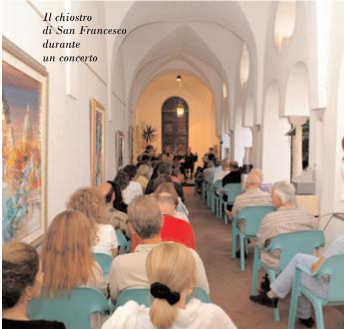
Il chiostro di San Francesco durante un concerto

DOMENICA 26 SETTEMBRE 2004 SANTISSIMI COSMA E DAMIANO