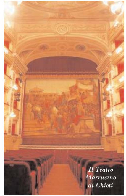
Il Teatro Marrucino di Chieti