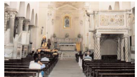
Photo: the sanctuary of Cosma e Damiano

° The sanctuary is open Sunday morning around 10 o'clock, mass time. Tuesday, Thursday, and Saturday the parish priest is on duty, so you can knock on the door of the nearby parish house, it is better in every case to phone beforehand: 089/857113.