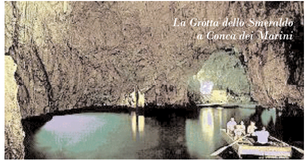
La Grotta dello Smeraldo a Conca dei Marini

During the summer conca dei marini becomes crowded with tourist who arrive from every corner of the globe, attracted by the healthiness of the climate and the crystal clear sea. There's good availability of hotels. Of particular artistic and touristic interest in the town there are: the convent of Santa Rosa (1330) and the Torre Bianca, erected in the XVI century to guard and defend from the Saracen invasion. The Emerald grotto is fascinating with its evocative view of bizarre stalactites and stalagmites against the background of an incredibly emerald- coloured sea. Agriculture is very important: lemons, new potatoes and the characteristic "hanging" tomatoes (very small tomatoes which are kept hanging from the walls).