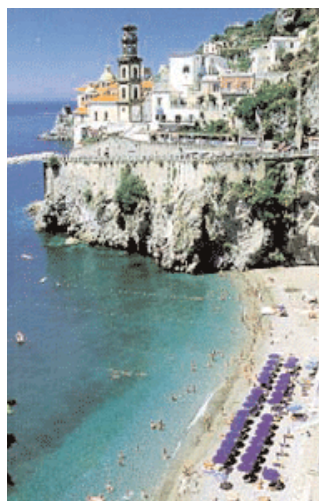
La spiaggia di Castiglione e Atrani di notte. In basso: Positano

(* via / trough Scala) (* Feriale/ working day) (biglietto / ticket: 1 euro)