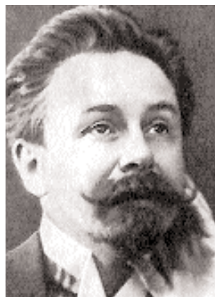
In alto e qui a sini- stra: due ritratti di Alexander Scriabin