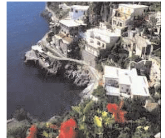
La costa di Praiano

Piccolo borgo di origine marinara, prediletto dai dogi amalfitani, lontano dai flussi di massa, ma al centro dello scenario costiero, offre panorami di incanto - che spaziano da Amalfi fino ai Faraglioni di Capri - ed una vista stupenda su Positano e Li Galli. Stupende insenature dall'acqua cristallina, testimonianze artistiche tra le più pregevoli della Costa, una tradizione culinaria incontaminata ed un'ospitalità genuina entusiasmano l'ospite. / Praiano is a small fishing village also well equipped for tourism. It was the summer residence of the Doges, chosen by King Carlo I D'Angiò to be the seat of the university. In Praiano you must visit the parish church of San Luca Evangelista in which the relics of the saint are revered and one can admire some of the paintings of Giovanni Bernardo Lama, an artist of the 1500's. Another famous monument is the church dedicated to San Gennaro. Of great beauty is the polychromatic, multi- colored tiled dome; the belfry dates back to the end of the XVII century.