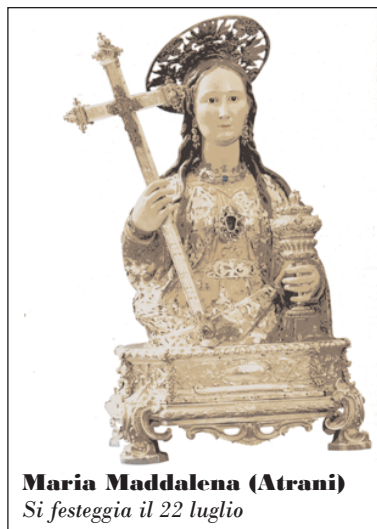
Maria Maddalena (Atrani) Si festeggia il 22 luglio