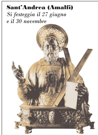
Sant'Andrea (Amalfi) Si festeggia il 27 giugno e il 30 novembre

duare la costante e radicata devozione nei riguardi dei patroni, segno di una religiosità di matrice arcaica che si esprime attraverso un singolare rapporto di appartenenza tra territorio e santi.