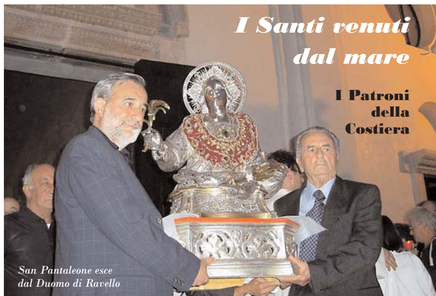
San Pantaleone esce dal Duomo di Ravello

SABATO 30 OTTOBRE 2004 Villa Rufolo, ore 21.30 Obermann violino and piano duo Le sonate per violino e pianoforte di Wolfgang Amadeus Mozart Posto unico 20 euro Ravello Concert Society