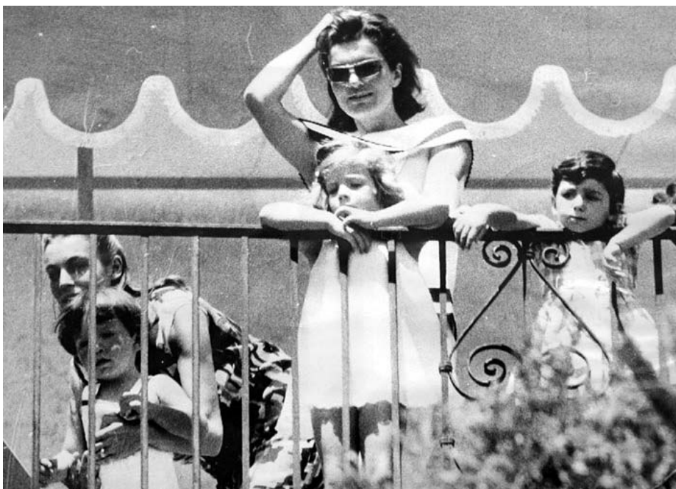
Jacqueline Kennedy in Ravello with the her children

Dutch. Certainly well supported by the excellent wine, wonderful food, excellent music, excellent cocaine (my supposition, it's clear), by the witty and ironic remarks. The pair must have found a good erotic and intellectual understanding; for what he called a "good catch", and she must have felt as if conquering an "Italian peak" like the Monte Bianco. As it is, I do not think that there were two people as averse to the concept of the word "love", and I doubt the word was ever spoken. The next morning, at dawn, she left for the States, and he disappeared towards other Tyrrhenian shores. It was the only time of the Avvocato and of the American First Lady. The only "posted" betrayal for the chaos they created from Capri to Ravello: Jackie cheated her husband practically setting banners. Maybe there was already on the scene some Marilyn Monroe, or some situation to deal "an eye for an eye".