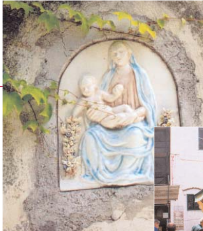
Due esempi di ceramiche della Costiera. Sotto, Minori di notte

Colorate, scaramantiche e talvolta fin troppo esplicite, tanto da rasentare i limiti della decenza. Sono le mattonelle della Costiera, collocate dinanzi alla maggior parte delle abitazioni. E Ravello non fa eccezione..