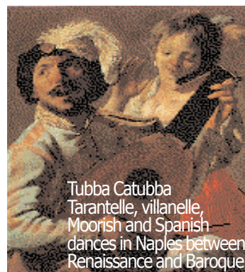
Tubba Catubba Tarantelle, villanelle, Moorish and Spanish dances in Naples between Renaissance and Baroque

the Tubba Catubba and Fandango!), and stage repertoires as Operas and Dances (Euridice, Il combattimento di tancredi e Clorinda, The Fairy Queen...). The natural inclination for research and experimentation brings Schola Romana Ensemble to face compositions of contemporary authors as A. Pärt, K. Penderecki, and G. Petrassi. Several composers have showed their esteem and consideration for Schola Romana Ensemble, stimulating the production of new music especially for what concerns the sacred Cappella music "La Nuova Rivista Musicale Italiana" (music magazine), published by Rai-Eri, dedicated a long article on the ensemble in the first issue of 2004. In December 2004, the programme Rai-Radio tre Suite "La stanza della musica" dedicated a broadcast to the group that performed live excerpts of its repertory. At present the ensemble is engaged recording for Italian Labels.