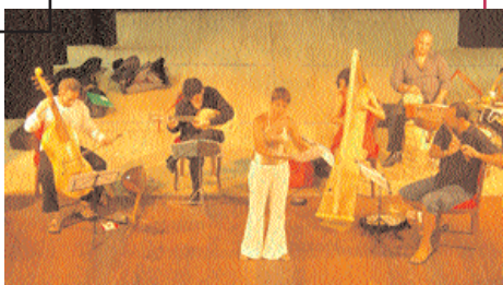
Live performance of the Schola Romana Ensemble

known as Schola Romana. The Schola Romana Ensemble was guest of the most important international Festivals as: Todi Arte Festival, Giugno Barocco, Le Corti della Musica, Estate Romana, Schola Romana Festival, Festival Cusiano di Musica Antica, Musica nelle Pievi, festival Internazionale di mezza Estate... On October 29th, 2002, the group performed in the presence of John Paul II. The repertory features vocal polyphony and music of Roman school from Renaissance to Baroque, exploring the manifold aspects and proposing the first modern accents. The ensemble also performs the ancient Neapolitan and Spanish popular repertory (with