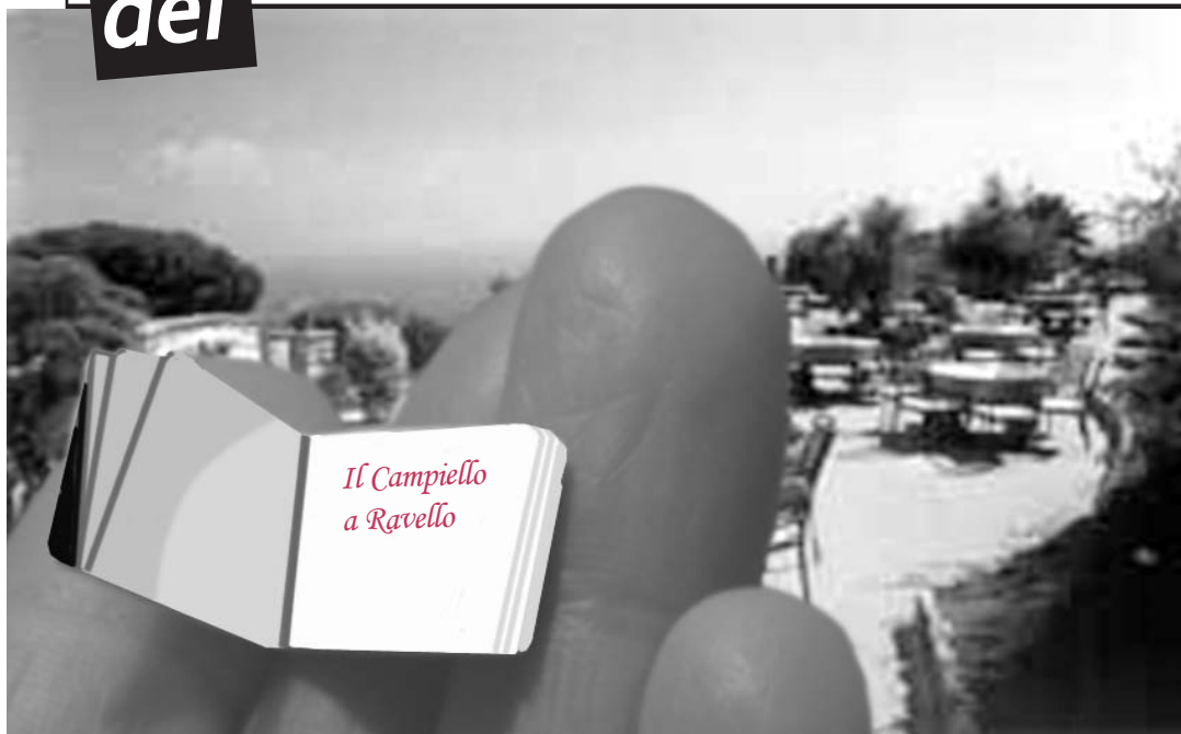
A lato, le copertine dei cinque libri finalisti al Premio Campiello edizione 2005