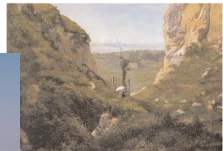
A sinistra, la costiera amalfitana. Sopra, il valico di Chiunzi, da sempre via d'accesso per Ravello