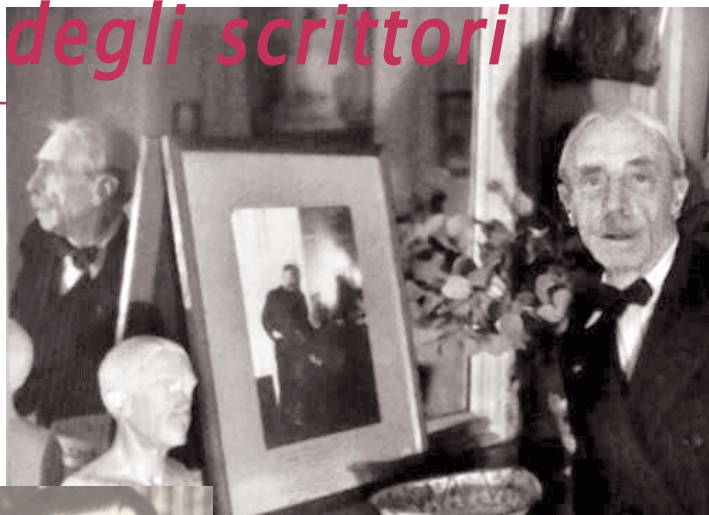
Sopra, Paul Valery. A sinistra, Domenico Rea. Sotto, lo scrittore inglese Edward M. Forster, autore di un racconto ambientato a Ravello scritto dopo un soggiorno in costiera