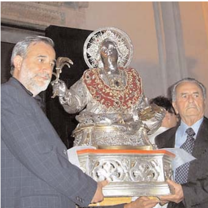
A sinistra, la statua di San Pantaleone portata in processione nel corso della festa del 27 luglio

Un convegno per ricordare la vita, le opere, e poi il culto e l'iconografia di Pantaleone da Nicomedia. Così Ravello ospita una due giorni di studi e testimonianze dedicata al suo patrono, in occasione del diciassettesimo centenario dalla morte per martirio del santo venuto dall'Oriente, avvenuta il 27 luglio del 305 dopo Cristo. Cresce così l'attesa per il prossimo lunedì, giorno dei rituali liturgici in onore di San Pantaleone: la comunità dei fedeli si riunirà in preghiera, in attesa che si ripeta come ogni anno il miracolo del sangue sciolto, dando così inizio alla processione ed alla festa patronale con i fuochi d'artificio.