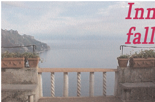
A sinistra, la costiera amalfitana. Sopra, il valico di Chiunzi