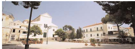
In alto, due scorci del paese, com'era e come è. Sopra, piazza Vescovado con alle spalle il Duomo

CONCERTO BANDISTICO ORE 12,00 E 22,30 FUOCHI D'ARTIFICIO ORE 22,00