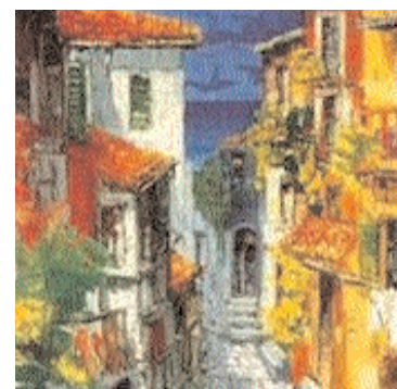
Opere di Luca Bellandi e Antonio Di Viccaro