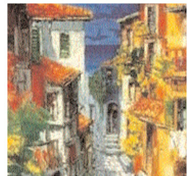
Opere di Luca Bellandi e Antonio Di Viccaro