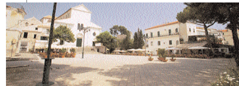
Sopra, piazza Vescovado con alle spalle il Duomo A sinistra, un'opera di Virginio Quarta

“Acquarelli per Ravello” è la mostra omaggio di Virginio Quaranta per la cittadina della Costiera. La personale è allestita presso l'Hotel Rufolo fino al 31 agosto (orari di visita, dalle 10 alle 22,30). Di seguito, riportiamo un brano dell'autore sulla mostra