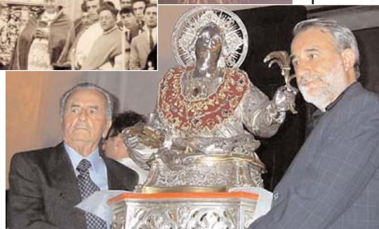
Nelle foto, alcuni momenti dei festeggiamenti e una foto di una processione "d'epoca"