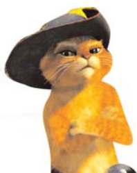
Posto unico euro 5

Retrospectiva - Spike Lee: per un cinema di contrasto