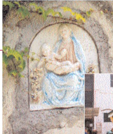
Quattro esempi di ceramiche della Costiera

Colorate, scaramantiche e talvolta fin troppo esplicite, tanto da rasentare i limiti della decenza. Sono le mattonelle della Costiera, collocate dinanzi alla maggior parte delle abitazioni. E Ravello non fa eccezione..