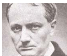
In alto, i Têtes de Bois. Sopra, Dino Campana e Charle Baudelaire