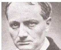
In alto, i Têtes de Bois. Sopra, Dino Campana e Charle Baudelaire