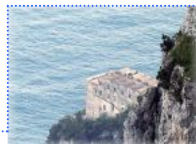
Chiesa di S.Rosa