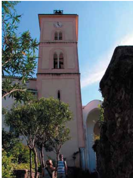
Chiesa di San Francesco

Domenica 20 Maggio Piazza Duomo S.Pantaleone festeggiamenti in onore del Santo Patrono