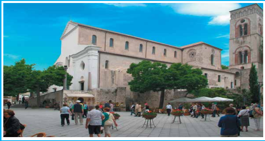
Piazza Vescovado e il Duomo

Una città si conosce non solo tramite la sua storia, i suoi monumenti ed angoli, ma anche attraverso la fede, legata alla tradizione che si tramanda. A Ravello, così come accade da secoli, le tradizioni sono un punto di riferimento che scandiscono il calendario. E il turista rimane incantato anche da questo suo aspetto. In questo numero vi invitiamo a partecipare, domenica 20 maggio , alla festa di “ San Pantaleone di maggio ”, presso il Duomo. E' la festa della traslazione della reliquia di San Pantaleone, il santo patrono di Ravello che si festeggia dal 1695. Una ricorrenza particolare ed antica per la Città della Musica, molto legata al suo Santo Patrono, che lo ricorda con tutti gli onori, ogni 27 luglio.