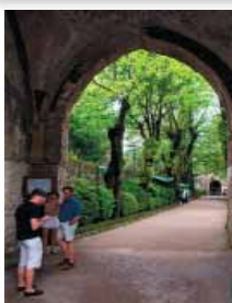
Ingresso Villa Rufolo

roof characteristic of the Amalfi Coast. The entrance towers were decorated with friezes representing winged and four-legged animals. A band is still visible midway up the external wall of the tower. He describes the walls of the Villa as covered with little terracotta columns and coloured stones. On the other hand, covered in patterns and ornaments were probably very tempting to any enemy.