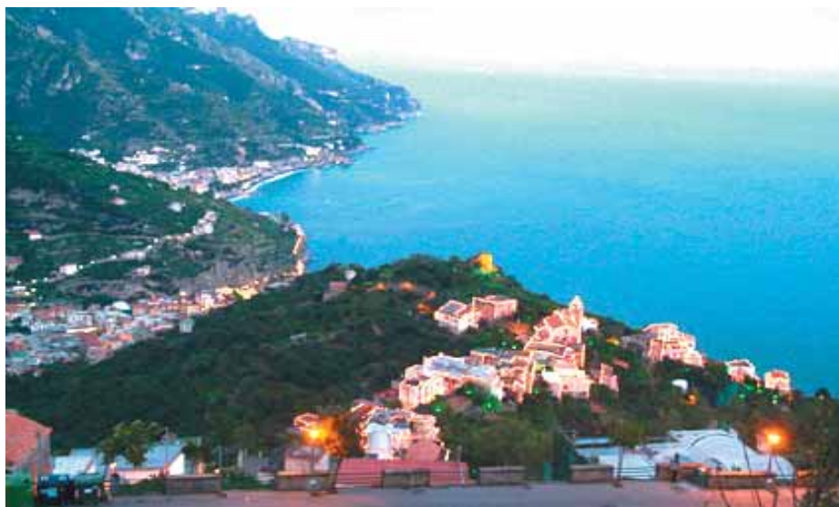
Torello, frazione di Ravello

Lo scorso anno per celebrare i 250 anni dalla nascita di Mozart, i nostri fine settimana speciali li chiamammo "Weekend Mozartiani", in onore del grande musicista. Quest'anno, sulla scia di quel successo, li abbiamo voluti denominare semplicemente "Weekend a Ravello", quasi a voler racchiudere nel nome di questa località, la specialità di questi momenti. Perché Ravello è di per sé un marchio. Una qualità. Un richiamo unico nel panorama turistico campano. E come Azienda di Soggiorno e Turismo non possiamo far altro che far conoscere maggiormente ogni suo angolo nascosto, che magari passerebbe inosservato, se non guidato con amore da chi conosce bene questo territorio.