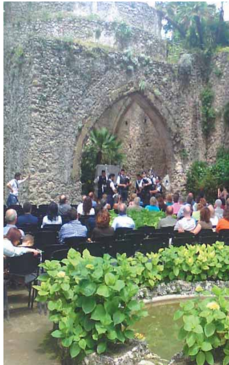
Concerto aperitivo a Villa Rufolo

Così come il concerto della domenica è gratuito: gli ospiti muniti di invito pagheranno il biglietto d'ingresso ridotto alla Villa Rufolo di 3.00. Gli ospiti di Ravello che assisteranno ai concerti di musica da camera del venerdì e del sabato organizzati dalla Società dei