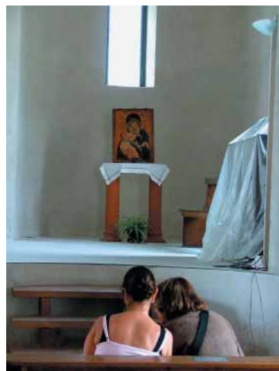
Turisti a Santa Maria del Gradillo

B uilt in the 11th century and transformed into Baroque style in the 1700's the church was completely restored to its original style from 1958-63. There is evidence of local architecture in this church because mixed into the classic theme is evidence of Byzantine and Arab elements. In the Middle Ages Santa Maria a Gradillo was the parochial centre of the population where the citizens met for public discussions.