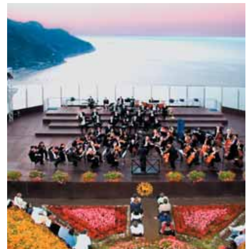
Un concerto durante il Festival di Ravello