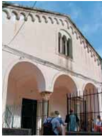
San Michele Arcangelo in Torello

N on perdetevi questi angoli nascosti. Insieme alla nostra guida, la scorsa settimana, abbiamo condotto i nostri ospiti lungo antiche stradine e scalinatelle, che partono da Villa Rufolo, fino ad arrivare alla frazione di Torello. Lungo questo percorso immerso tra archi, bouganville che si inerpicano sui muri, e vedute spettacolari, si incontra la Chiesa della SS. Annunziata . La riconoscete dalle sue due cupole con archetti e piccole finestrelle, e dal suo stile romanico a tre navate. Costruita nel 1281 dalla nobile famiglia Fusco, ha subito varie trasformazioni. La Chiesa era ricchissima di monumenti,