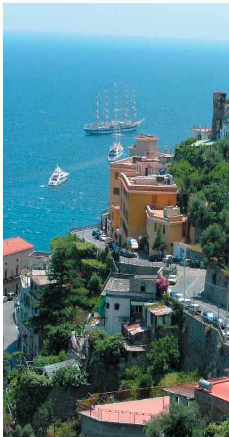
Parte della frazione di Castiglione

La storia racconta che nel 1568 ci fu una grande lite – approdata dinanzi alla Magna Curia di Vicaria – tra la chiesa di Ravello (denominata Capitolo) e Atrani. Il motivo era il “ diritto di pescare nella marina di Castiglione; privilegio che quel Capitolo godeva ” e che poteva affittare con la somma di “ ducati 31 e grani 12 e mezzo ”, riscuotendo così la “decima” (la tassa) annualmente sul pesce che si pescava. Questo diritto fu mantenuto nonostante le liti anche con Amalfi, sino al 1800 inoltrato.