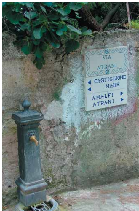
Stradina per Castiglione mare e Amalfi