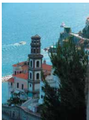
Atrani vista da Castiglione

film girate da Adriano Celentano negli anni '70, o di Jacqueline Kennedy che prima di andare alla spiaggia di Conca dei Marini – più riparata da occhi indiscreti - sostava qui per un tuffo. Indiscutibile l'emozione che si può provare in un contesto del genere. Dalla spiaggia basta guardare su in alto, e vedere ergersi maestosa la cupola della chiesa della Maddalena di Atrani . Uno spettacolo unico, una prospettiva particolare e suggestiva. Ma Castiglione non è solo località di mare, è anche una deliziosa frazione, che si raccoglie intorno alla sua piccola chiesa dedicata a San Filippo e Giacomo . L'itinerario consigliato e suggestivo per arrivarci è quello dei gradini che partono dal centro di Ravello, e tra curve che si intrecciano con la strada rotabile e le scalinatelle, vi ritroverete un po' alla volta – tra boschi e limoneti del monte Civita - presso la piccola frazione, che nel corso della storia ha avuto sempre un'enorme importanza nell'economia di Ravello. Imbattetevi poi nel suo interno, dirigendovi verso la chiesetta, cuore pulsante della piccola comunità, molto attiva e impegnata. Scoprirete un piccolo mondo : antichi portali, con bouganvillee che li ammantano di mille colori, vi faranno ritornare indietro nel tempo. Dalla piazzetta della chiesa il colpo d'occhio sarà poi straordinario: giù la spiaggia con il suo mare. E il tratto di costa, sinuoso, vi ricorderà che qui ogni angolo è solo un'eterna emozione che si rinnova .