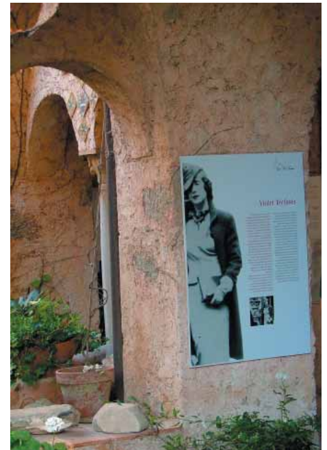
Villa Cimbrone, nella foto a sinistra la conferenza sul circolo Bloomsbury