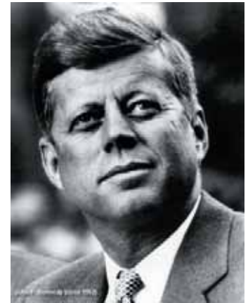
John F. Kennedy

What makes a place immortal? Surely a monument, but also a mix of history and myths told over and over again. Ravello has many stories told and recorded over the years, and now traces of the town are appearing in blogs worldwide. A new way of recording memories, appreciation and critiques that anyone can read and search for. On the blog Grapewine (www.http://blog.libero.it/Grapewine/view.php?reset=1&id=Grapewine) the author describes the night of Saint Lorenzo at the Villa Rufolo, the before dawn concert: After many years, this night has been the first Saint Lorenzo without seeing any shooting stars. Covered skies? No, in fact the stars were shining abundantly, but I found it impossible to observe them when in front of me seventy five people were playing music. I have never seen anything like it, a fantastic experience. In these personal online diaries there is a whole world of writings and different points of view. Blogs that talk of Ravello being a little ancient world, photos of visitors and the views, personal memories and experiences.