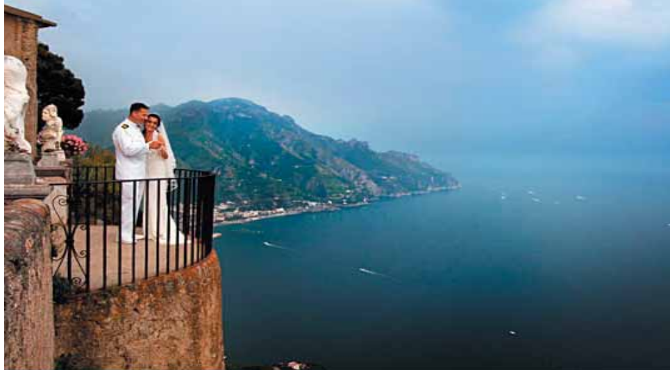
In alto a destra Leopold Stokowski, in basso Greta Garbo. La celebre coppia visse a Ravello un' intensa storia d'amore